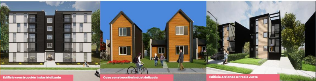
Edificio construcción Industrializada